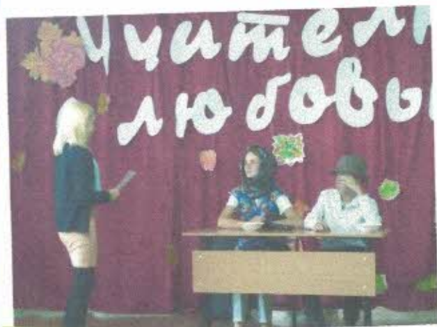
8 класс. Сценка «Один день в учительской семье»