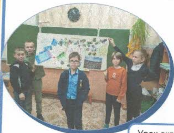
Урок окружающего мира в 4 классе