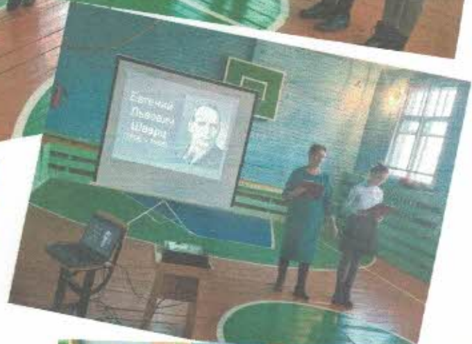
Литературный праздник, посвященный Евгению Львовичу Шварцу.