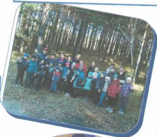
2 класс с родителями в походе в октябре.