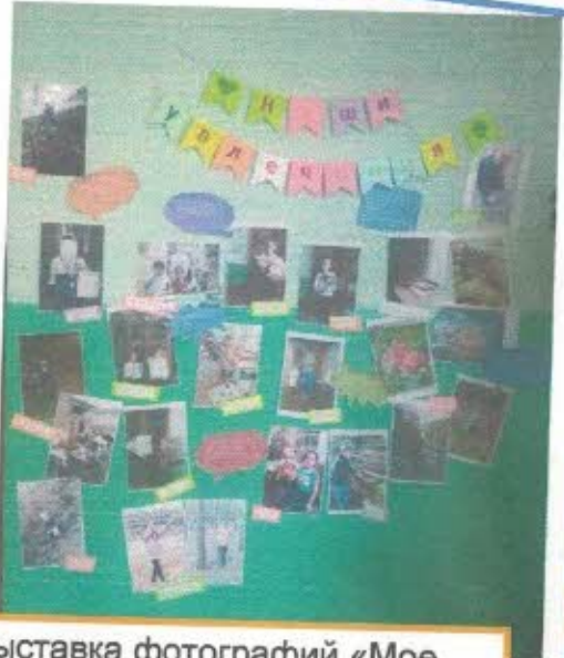
Выставка фотографий «Мое увлечение»