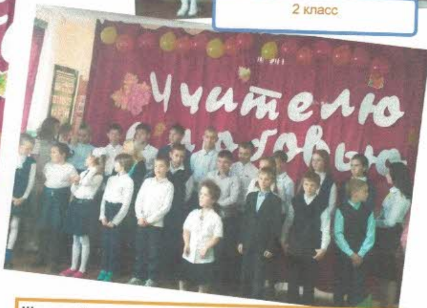
Школьный хор с песней «Учитель, учитель...»