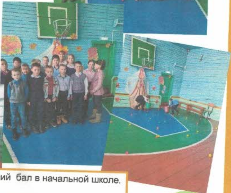
Осенний бал в начальной школе.