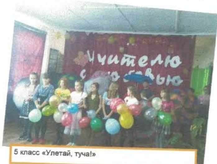
5 класс «Улетай, туча!»