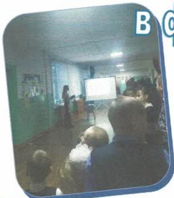
Тематическая линейка, посвященная Дню слепого человека